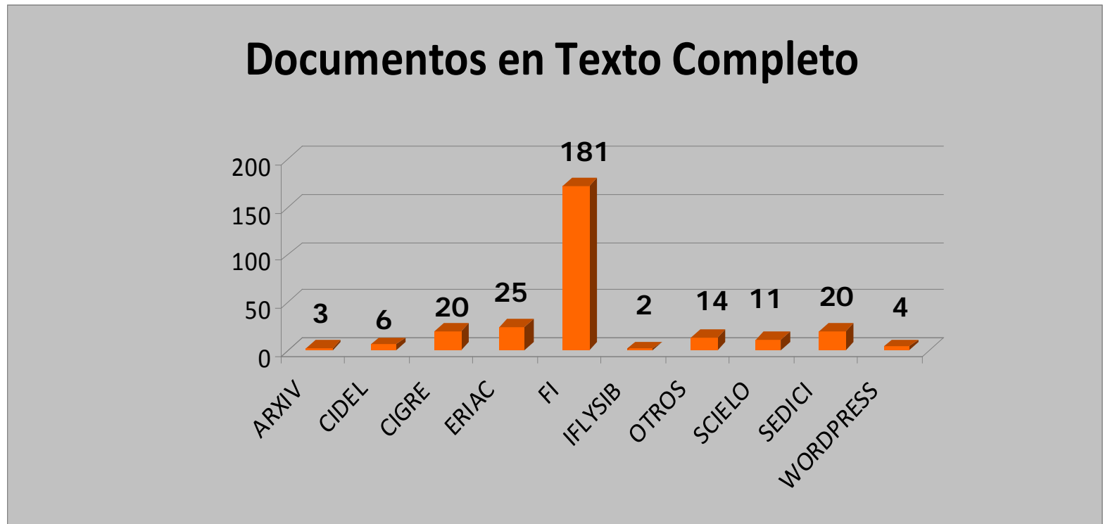
Gráfico 1: Documentos en texto completo